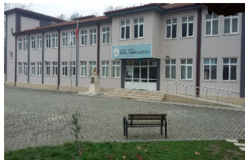
Kemal Yener İlk-Ortaokulu